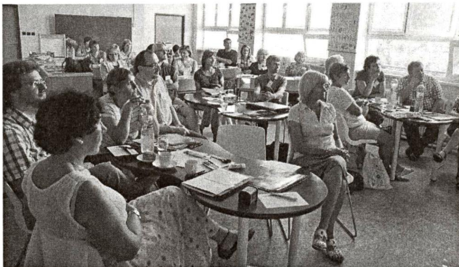
Účastníci projektu při chraštické konferenci

Kromě ZŠ a MŠ Chrašnice byly dalšími partnerskými školami ještě Masarykova jubilejní ZŠ Hřebeč, MŠ Hostouň a Základní škola praktická, Základní škola speciální a Mateřská škola speciální Kladno.